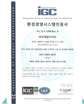
ISO14001 [환경경영시스템] 인증