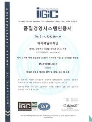
ISO9001 [품질경영시스템] 인증