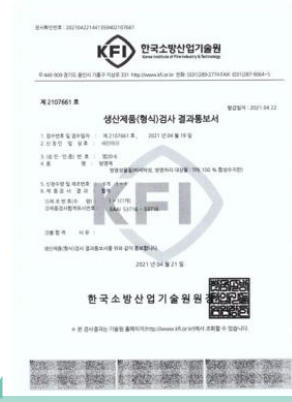
방염제 생산제품 승인서